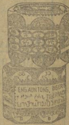
Dolem goetji ketjil merah dan poeti

Obat tjap Matjan tida boleh tida ada di toean poenja roemah, kerna tida ada obat lebih baek boeat semboehken. Rheumatiek, sakit boekoe toelang dan spier, kasaleo dan pilek dari pada ini obat oemoem. Djoega boeat laen-laen penjakit dan ganggoean obat tjap Matjan ada mandjoer. Tjoba soeroe toean poenja boedjang beli boeat satalen satoe goetji ketjil Obat Matjan. Toean pasti aken dapet kafaedahan dari ini.